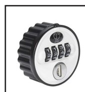
Serrure à code avec décodage clé